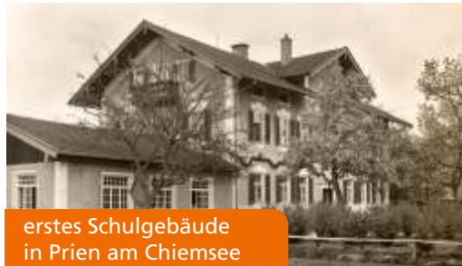
erstes Schulgebäude in Prien am Chiemsee

Gründungsjaar: Unterbringung in der Jugendherberge in Prien am Chiemsee.