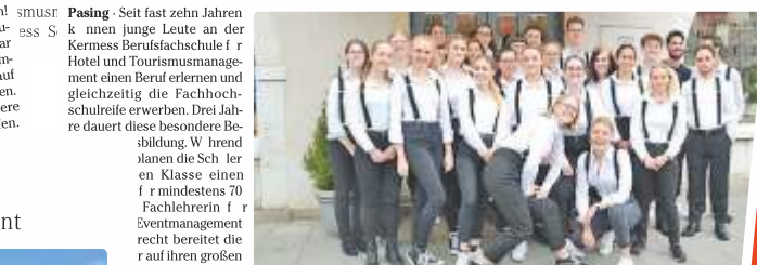
Seit fast zehn Jahren feiern die zwölften Klassen der Kermess Berufsschule für Hotel- und Tourismusmanagement ein Galaabend mit Dinner und Programm. Die Veranstaltung wurde von den Schülern sehr gut aufgenommen und wurde als ein wichtiger Bestandteil der Ausbildung angesehen. Die Schüler erhielten wertvolle Einblicke in die verschiedenen Bereiche des Hotel- und Tourismusmanagements. Die Veranstaltung wurde als ein erfolgreiches Ereignis angesehen, das die Schüler auf die bevorstehende Ausbildung vorbereitet hat. Die Schüler sind stolz auf ihre Leistungen und auf die Unterstützung der Lehrkräfte.

Galaabend mit Dinner und Programm der zwölften Klasse der Berufsschule