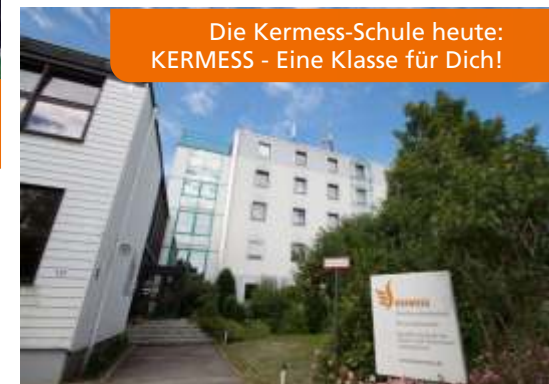
Die Kermess-Schule heute: KERMESS - Eine Klasse für Dich!

Komplette Renovierung des Schülerwohnheims, der Klassenzimmer sowie die Neugestaltung des Eingangsbereiches