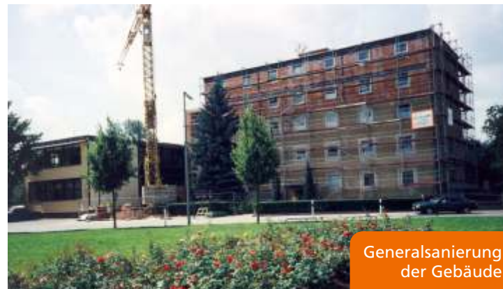
Generalsanierung der Gebäude

Erweiterung der Wirtschaftsschule um einen 2-jährigen Zweig erforderte eine erneute Baumaßnahme. Aus dem Untergeschoss des Schülerwohnheims wurden aus Zimmern mit Bädern zwei neue Klassenräume sowie eine neue, wesentlich größere Übungsfirma, die auch als TV-Raum genutzt werden kann. Statisch war dies eine schwierige Aufgabe, da durch das Entfernen von zum Teil tragenden Wänden riesige Unterzüge eingebaut werden mussten, um das Gebäude zu stabilisieren.