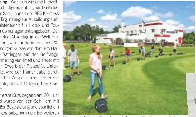
Mit sportlichem Ehrgeiz trainierten die Kermess-Schüler Golfschwung.

Ausbildungsergänzung fürs Tourismusmanagement