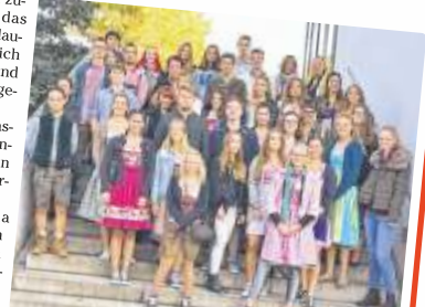
Die 11. Klasse der Mönchnbergschule für Hotel- und Tourismusmanagement bei Kermess startete 12. Klasse Kennenlern-Tag ins neue Schuljahr, den die