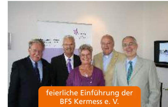
feierliche Einführung der BFS Kermess e. V.

In nur drei Jahren können Schüler und Schülerinnen mit einem erfolgreichen Mittleren Schulabschluss in der Kermess Berufsfachschule nun nicht nur einen Beruf erlernen, sondern gleichzeitig die Fachhochschulreife erwerben.