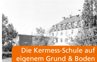
Die Kermess-Schule auf eigenem Grund & Boden

4. März: Einweihungsfeier. Zum ersten Mal befand sich die Kermeß-Schule auf eigenem Grund und Boden.